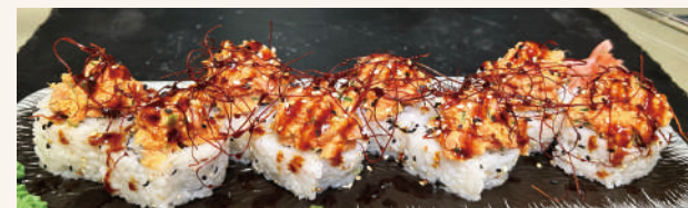
SR6. Crazy Tuna Roll CDN €13,90 mit Tempura Garnelen, Thunfisch Tartar, Avocado, Spicy Mayo Sauce und Teriyaki Sauce