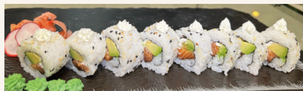
SR1. Philadelphia Roll DN €10,90 mit Lachs, Avocado und Philadelphia