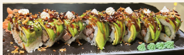
SR2. Agamo Roll CN €12,90 mit Ente, Avocado, Gurken, Philadelphia und Teriyaki Sauce