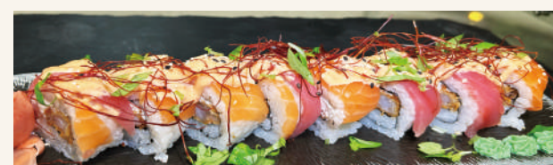
SR8. Spicy Sakura Roll CDN €13,90 mit Tempura Garnelen, Philadelphia, Lachs, Tunfisch und Spicy Mayo Sauce