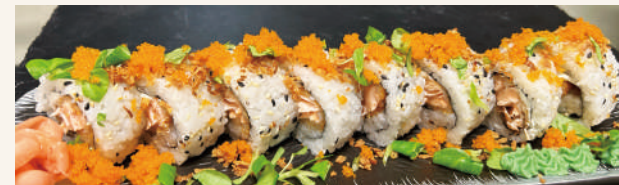
SR7. Aiko Roll DN €12,90 mit Lachs Tempura, Philadelphia, Rostzwiebeln, Tobico