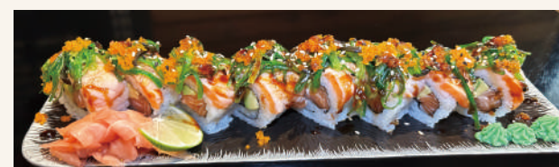
SR10. Aburi Sake Roll BN €13,90 mit geblämmter Lachs, Avocado, Seetangsalat, Lachs, Masago und Teriyaki Sauce