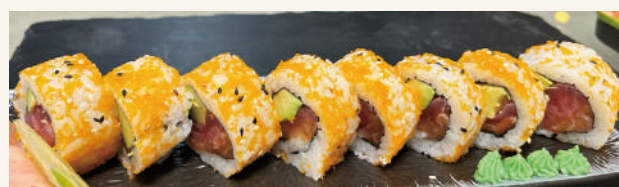
SR4. Kaviar Roll DN €12,90 mit Lachs, Thunfisch, Avocado und Tobico